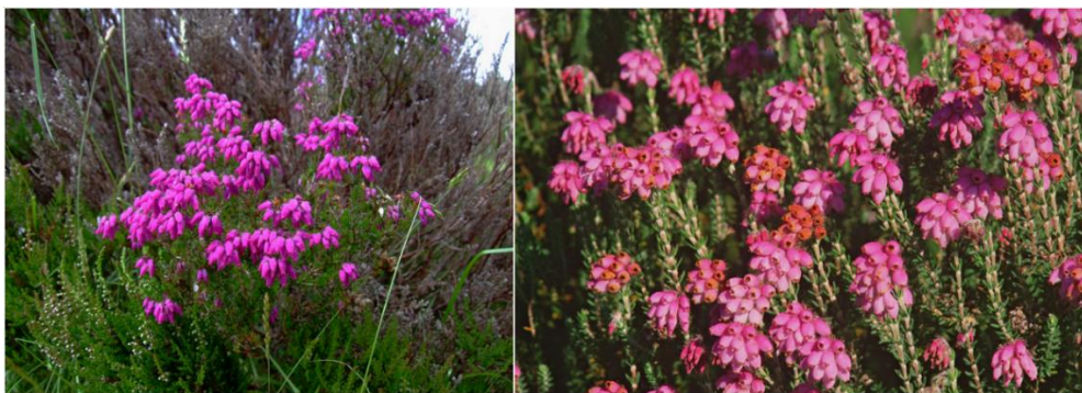
The larger, brighter flowers of Bell Heather (left, © nz_willowherb via Flickr CC) and Cross-leaved Heath (right, © Natural England via Flickr CC).