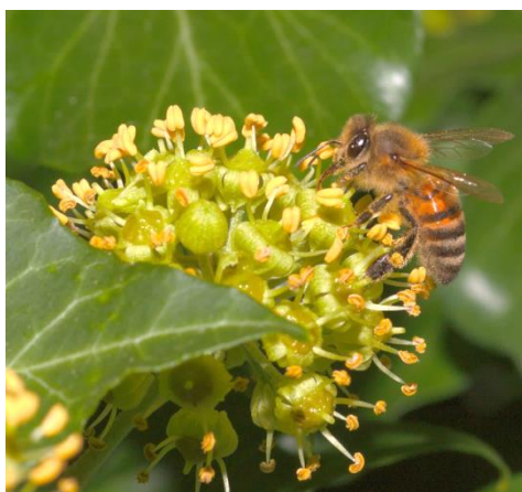
Gwenynen fêl ar flodyn iorwg

Dylai cyfrifon blodau fod yn seiliedig ar nifer pennau'r blodau (a nodir gan hirgrynon gwyn ar yr ochr chwith yn y cyfuniad o luniau uchod).