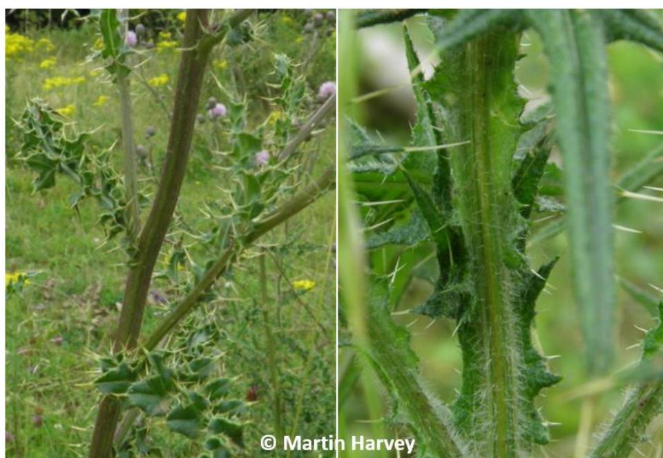
Creeping Thistle has no spines on its stems (left), Spear Thistle has spiny stems (right).

Gwelir y Farchysgallen , Cirsium vulgare , mewn ystod eang o gynefinoedd, yn cynnwys porfeydd wedi eu gor-bori a glaswelltir garw, clogwyni morol, twyni, llinellau cyfeiriad y llif a chynefinoedd wedi eu hafloynyddu yn cynnwys caeau â'r, tomenni sbwriel, tir gwastraff ac ardaloedd llosg mewn coetir. Mae'r blodau'n fwy ac yn borffor tywyllach nag Ysgallen y Maes a chyda'r Farchysgallen ceir pigau ar y dail a'r coesau.