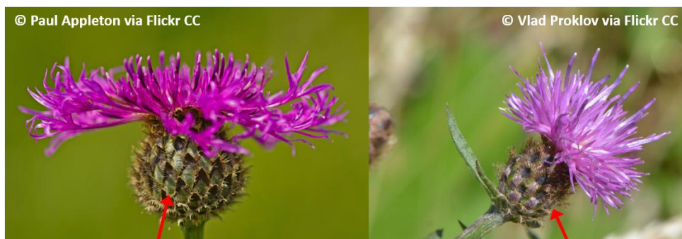
Greater Knapweed: bracts green with a narrow brown edging